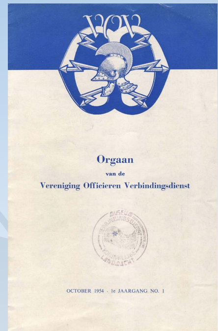
Orgaan VOV 1954

In de periode dat de VOV een slapend bestaan leed, werd op 4 oktober 1969 een vereniging opgericht die als naam had "Reüniefonds Cadetten wapenvereniging Prinses Marijke".